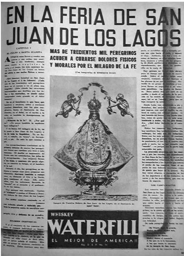
Figura 2. Presentación de la primera entrega del fotorreportaje. Fuente: "En la Feria de San Juan de los Lagos", HOY, núm. 157, 24 de febrero de 1940. Fotografía © Enrique Díaz Reyna.

tridimensional. Sin duda existía una agenda de propaganda de las tradiciones nacionales, de las cuales los ritos religiosos y las obras pictóricas formaban parte.