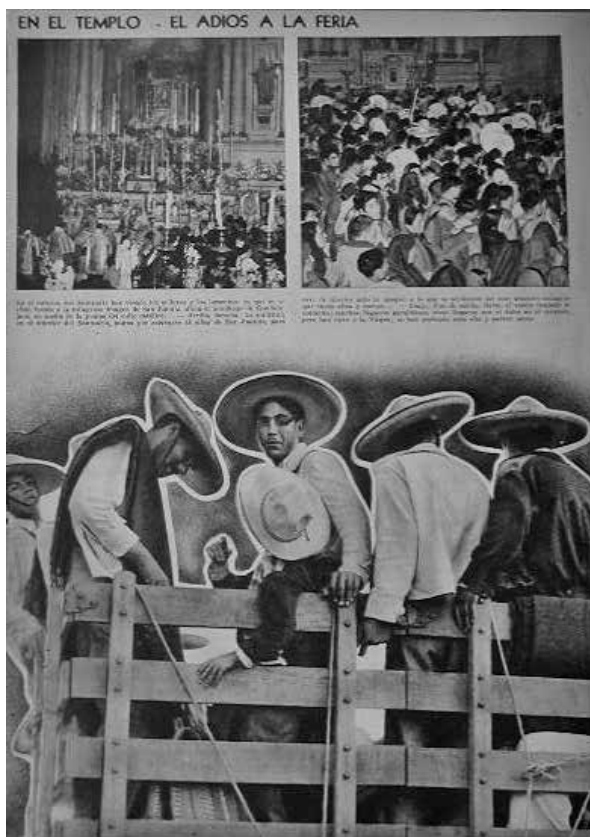
Figura 7. En el templo... el adiós a la Feria.

posible. Si este impacto visual inmediato no es intrínseco a una toma en sí misma, se crea en la mesa editorial en la puesta en página a través de reencuadres, ediciones y redimensionamientos de las fotografías o fragmentos de las mismas. Este esfuerzo consciente por crear un efecto dramático es lo que identifico como la retórica visual particular de las revistas. Esta puesta en página se acerca a lo que se entiende como la "puesta en escena" de una obra teatral. Sin embargo, la tendencia hacia cierto melodrama no es particular de la visibilidad gestada y difundida por las revistas. Como ya ha mostrado José Luis Barrios, el discurso cinematográfico también privilegió un