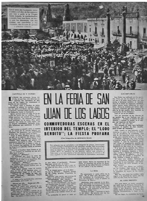
Figura 6. Conmovedoras escenas en el interior del templo.

siguiente (figura 6). El cierre visual del reportaje se marca mediante una escena donde aparecen unos hombres y un muchacho montados en la parte trasera de un camión, similar a la de la primera parte del reportaje, aunque aquí no funcionan como preludio y llegada, sino como cierre y partida (figura 7).