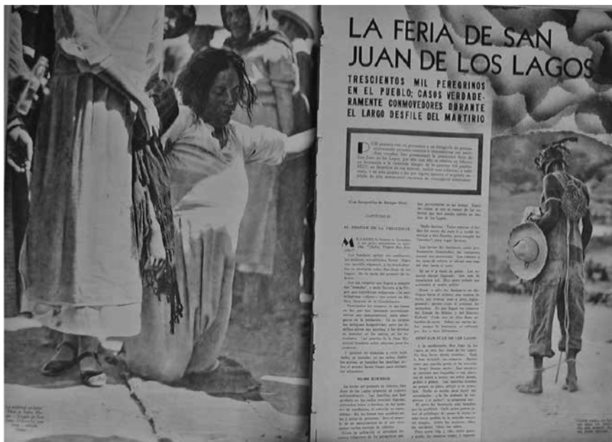
Figura 4. Trescientos mil peregrinos en el pueblo; casos verdaderamente conmovedores durante el largo desfile del martirio.

dita la incuestionable relación de la obra del pintor con la fotografía de Enrique Díaz. 21 Es Rebeca Monroy quien comenta tal relación en Historias para ver: Enrique Díaz, fotoperreportero . Al respecto, Monroy nos aclara: