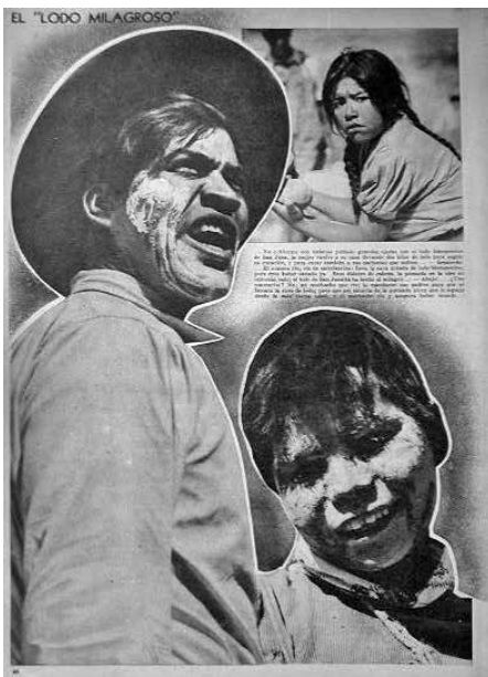
Figura 8. El “lodo milagroso”.

de autor”. Es decir, a pesar de que hoy día sabemos más sobre algunos de estos fotorreporteros, como es el caso de Enrique Díaz Reyna —en ese caso, gracias al trabajo de Rebeca Monroy—, es imposible afirmar con seguridad el grado de injerencia que tuvieron los fotógrafos en la edición de sus imágenes, actividad que se hacía en la mesa del editor. En cierta medida, el concepto de autoría deviene menos relevante para la comprensión de la nota como un conjunto imagen/texto impreso, en particular, por el mismo carácter colectivo del fotorreportaje. Muchas de las imágenes, además de estar editadas de manera rectangular o cuadrada, están redimensionadas o desdimensionadas en recortes de silueta, a veces con un efecto de “cortador de galletas” lo que ayuda a conformar la puesta en página. En esas fotografías el concepto de fotógrafo-autor parece disolverse con mayor contundencia y el editor-autor adquiere una nueva estatura. Un ejemplo son las figuras que muestran a los fieles con los rostros cubiertos de lodo, cansados pero satisfechos por el logro de la manda (figura 8). Dentro de la serie del fotorreportaje, estas imágenes