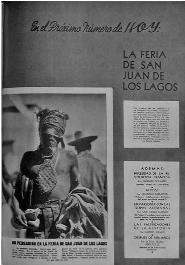
Figura 1. Anuncio del fotorreportaje. Fuente: “En el próximo número de HOY: En la Feria de San Juan de los Lagos”, HOY, núm. 156, 17 de febrero de 1940, p. 11. Fotografía © Enrique Díaz Reyna.

te, que evidentemente se ha detenido para posar, no se aprecia la sangre. Es el pie de foto el que crea la imagen del romero que sangra. La retórica combinada de los textos y la fotografía apela al morbo