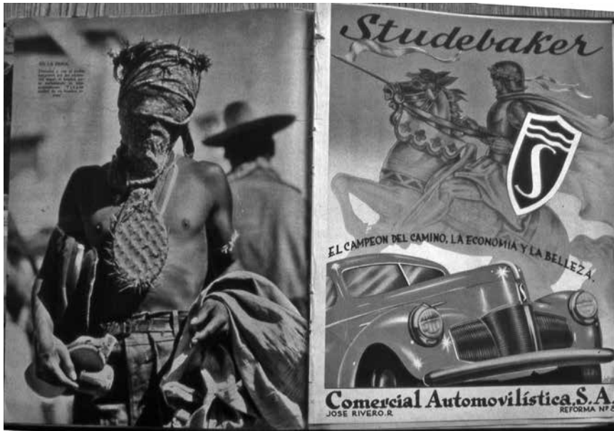
Figura 9. En la Feria.

Para acercar más el significado de las imágenes de los penitentes a su propio horizonte histórico, Berenice incluyó, aunque sin comentar, unas fotografías de la peregrinación llamada “de la Santa Cruz” a la Feria de San Juan de los Lagos, Jalisco, realizadas por unos conocidos suyos, imágenes que, trabajadas, podrían arrojar cierta luz sobre la resignificación religiosa, antropológica e identitaria del ritual de participación en la peregrinación, así como del registro fotográfico de la misma. Es decir, actualizar la experiencia cultural de la tradición religiosa y ponderar el valor testimonial/documental de la fotografía en estos casos particulares, donde se reafirman identidades culturales, sentimientos de solidaridad de grupo, y se regeneran los valores simbólicos de algunos objetos, actos y sentimientos colectivos. También implicó que Berenice trajo a su investigación una experiencia de la romería más cercana a su presente y su círculo de socialización, y al hacerlo empezó a cuestionar su papel de observadora distante para poner en juego la posibilidad de una cercanía (¿afectiva?) mayor con esta práctica. Justo aquí el entrecruce de la experiencia de historiar y la de hacer antropología (visual)