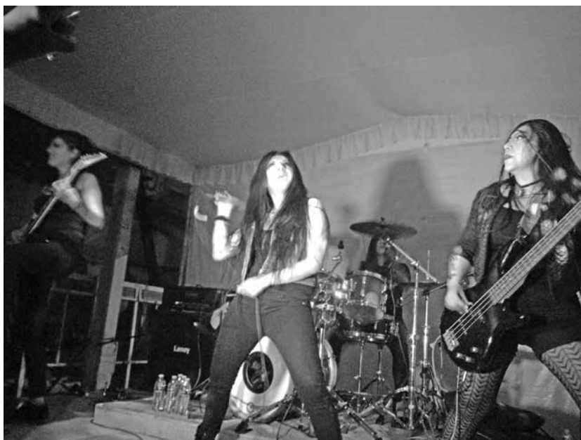
Figuras 10 y 11. Introytl sobre el escenario.