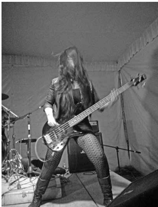
Figura 12. Estética femenina de Introtyl.

La audiencia mira y escucha con atención a la banda, cuya vocalista agradece a los asistentes y organizadores. No se presentan rechiflas, aunque alcanzamos a escuchar entre los asistentes cosas como “están buenas, ¿verdad?”. La indumentaria de las integrantes de Introtyl constituye uno de los alicientes de este tipo de comentarios. Si bien no existen insinuaciones ni rechiflas al momento del acto performativo, sí se da un proceso de cosificación, aunque en menor escala. Al igual que en el Salón Bolívar, no se generó un slam ni un mosh pit , ya que la audiencia prestaba más atención a las músicas para apreciar su presentación y para tomarles fotografías. 72