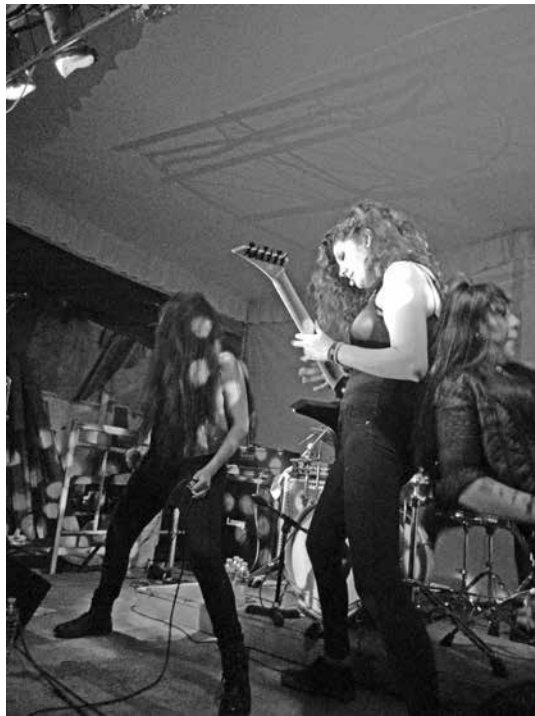
Figuras 13 y 14. Potencia y hermandad en la presentación de Introtyl.